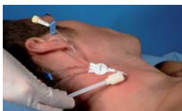
Ošetření okolí I.V. vstupů.