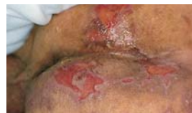
Léčba již poškozené kůže a prevence macerace