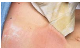
Chrání pokožku před adhezivou.